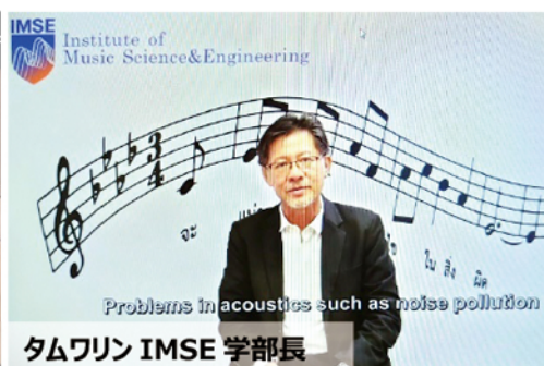
タムワリン IMSE 学部長