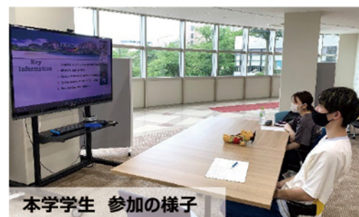
本学学生 参加の様子