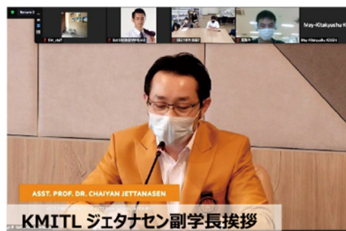
KMITL ジェタナセン副学長挨拶